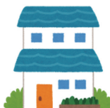
住む予定のない不動産

維持費（修復、管理など）、管理費用が掛かり、固定資産税（税金）を払い続けなくてはならないなど不動産を保持していることで負担になることがあります。